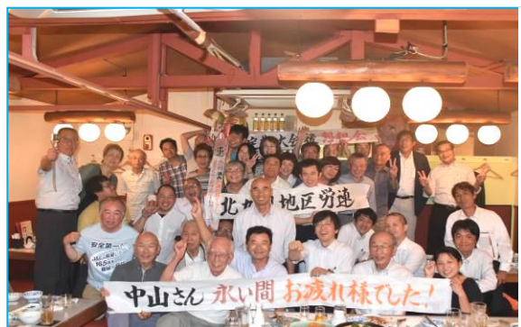
■大会終了後の懇親会に 41人の役員・代議員が参加しました。