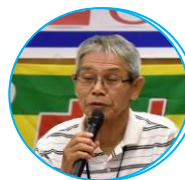
年金者組合 都城代議員

日本が再び戦争する国にならないように戦争法廃止に頑張る。医療介護を守るために医療労働者として頑張る。長時間夜勤労働者のリスク、人員不足、勤務インターバル、適切な看護基準、ILO条約基準を守らせる。