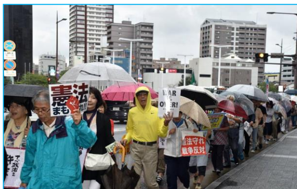
■平和をあきらめない 9・19集会&パレード

③ その上で同法20条に反する定年後の有期労働契約労働者の賃金の定めは無効であるから、正社員の賃金の定めが適用される。として、原告の請求を認めました。 当然、被告会社は控訴しており、確定したものではありませんが、継続雇用制度で賃金の切下げがあるのは当然である、と使用者の考え方に一石を投じる画期的な判決であったと考えられます。 今後の控訴審の判断が注目されます。