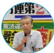
J. M. I. T. U. 鉄工支部 香川代議員

2016年に、妊婦に対する不法行為責任があるとして、勝訴したが、35万円という低い慰謝料だったので、このままでは、35万円払えば、解決するということとなってしまったので控訴し、たまたまかっています。結審し、判決となるので、引き続き署名や傍聴参加などご支援をお願いします。