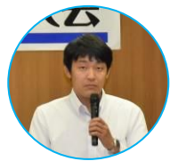
福建労 北九州支部 平安代議員

10月24日 判決です。公正な判決を求める署名をよろしくお願ひします。国立病院機構の小倉医療センターのたたかいは、調理部門の委託化に伴う団体交渉申入れを拒否していることに対する、労使関係を正常化するたたかいです。署名をよろしくお願ひします。