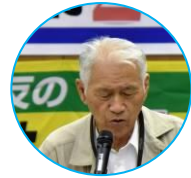
JMITU 八幡地域支部 雪竹代議員