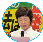
北九州学嘱労 出口代議員

改憲阻止、核兵器廃絶の取り組みについて、門司赤煉瓦会館でピースフェスタ10月1日に行います。