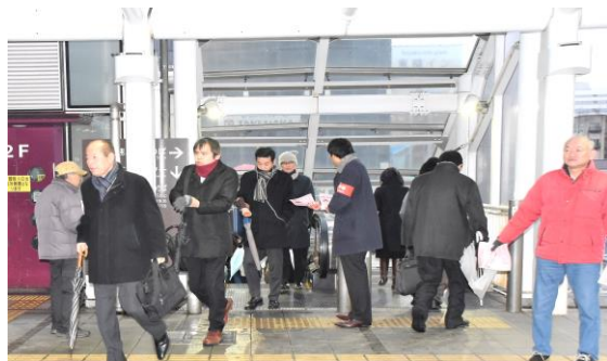
寒さの中、チラシ配布とマイク宣伝を行いました

4 そもそも、何らかの労働者の退職に向けた行為があるとしても、労働者が使用者に使用されてその指揮命令に服すべき立場に置かれており、自らの意思決定の基礎となる情報を収集する能力にも限界があるや、労働契約を終了させるということはそれ以降の生活のための賃金をもらうことができなことを意味しますから、その行為をもって直ちに労働者の同意があったものとみるのは相当ではなく、労働者の同意の有無についての判断は慎重にされるべきという最高裁判例もあります。 結論として、退職届を書いたらそれで終わりというわけではないということですが、