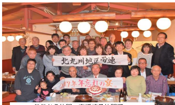
たたかう仲間、支援する仲間と和やかに懇談・交流しました。

12月27日に、北九州地区労連、北九州地域ユニオン、争議団共闘会議で、2017年忘れの宴で、今年最後に、1年間のたたかいを振り返り、未払い賃金や職場復帰で大きな勝利を勝ち取ったことを喜び合い、厳しかったたかいで年越しとなった事案の早期解決をめざし、決意を固めあうために開かれました。34人の仲間が参加し、笑いあり、涙ありで和気あいあい懇談し、新しい年のたたかいへの決意を固めました。