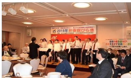
オープニングは、北九州のうたごえ