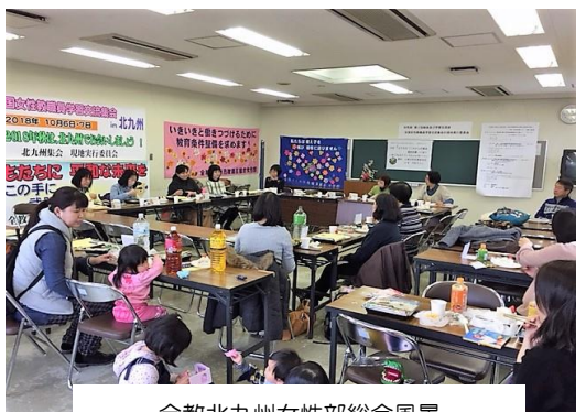
全教北九州女性部総会風景