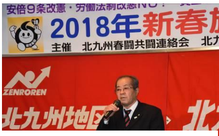
江口県労連議長の来賓挨拶