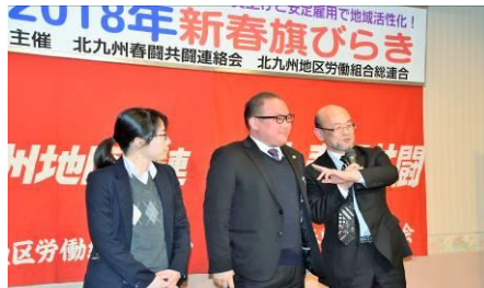
北九州第一法律事務所の新人弁護士紹介