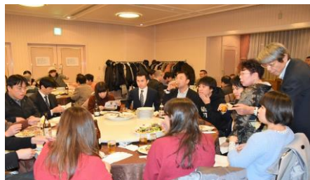
健和会労組のテーブルに三輪市民の会事務局長