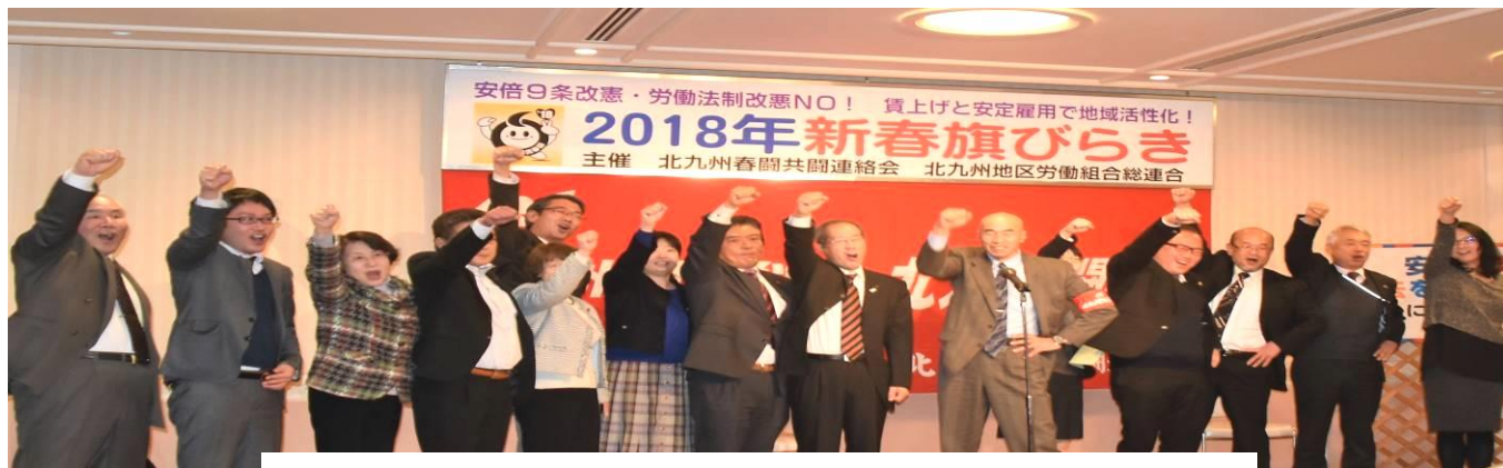
8時間働けば人間らしい暮らしが実現する2018年春闘をめざし団結して頑張るぞ〜