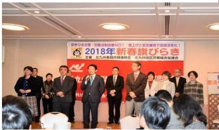
日本共産党を代表して 田村衆議院議員が挨拶

2018年春闘のスタートにあたって、恒例の「新春旗びらき」が、1月12日、小倉リーセントホテルで開催されました。