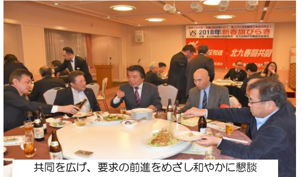
共同を広げ、要求の前進をめざし和やかに懇談

連絡先 北九州市小倉北区黄金1-4-9-207号 メール k_roren@ybb.ne.jp 093-921-0747 ホームページ http://www.geocities.jp/k_roren/