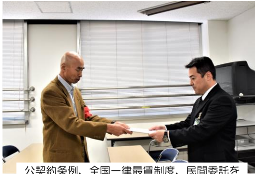
公契約条例、全国一律最低賃金制度、民間委託を中止。直営に戻せ。

直方市では、公契約条例を制定し、委託関連企業にアンケートを実施しています。今年のアンケート結果では、「成果があった」が4割を超えています。前回「期待できない」と答えた企業がありました。今回はゼロであり、条例制定が労働条件改善にプラスであることは間違いありません。