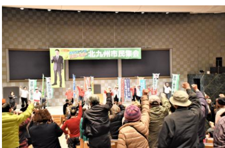
12・22市民大集会在国際会議場で開かれ、450人の労働者・市民が参加しました