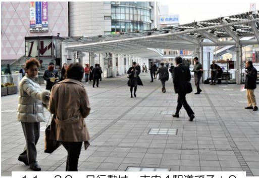
11. 30一日行動は、市内4駅道で7:00から取り km れ梯 m ス

36協定指針には、限度時間を超えて労働させる場合に講ずべき「健康福祉確保措置」について記述されており、勤務間インターバル・深夜業回数規制、一定時間超えた労働者への医師の面接指導、代償休日・特別休暇なども締結が留意すべき事項となっており、春闘に向け労働組合の役割がますます重要だと確信できた1日総行動の締めくくりに学習会でした。