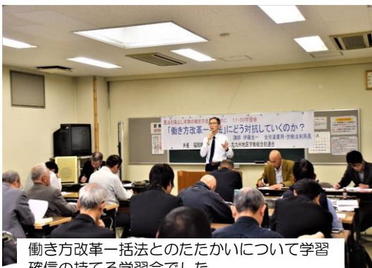
働き方改革一括法とのたたかいについて学習確信の持てる学習会でした。