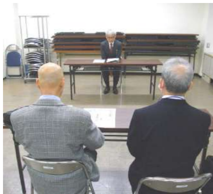
異例の議長と事務局長での一日要請行動になりました。