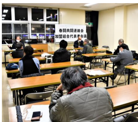
北九州春闘共闘 第1回加盟組合代表者会開催

次回加盟組合代表者会は1月19日（火）18時30分から市立生涯学習総合センターで行います。