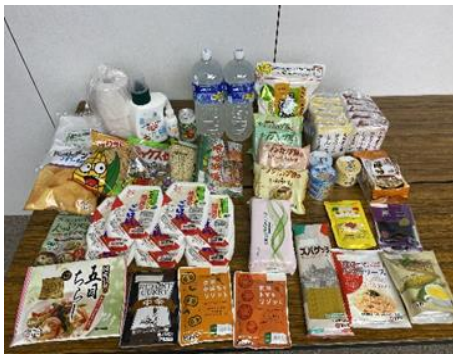
コロナ感染家庭に届いた支援物資